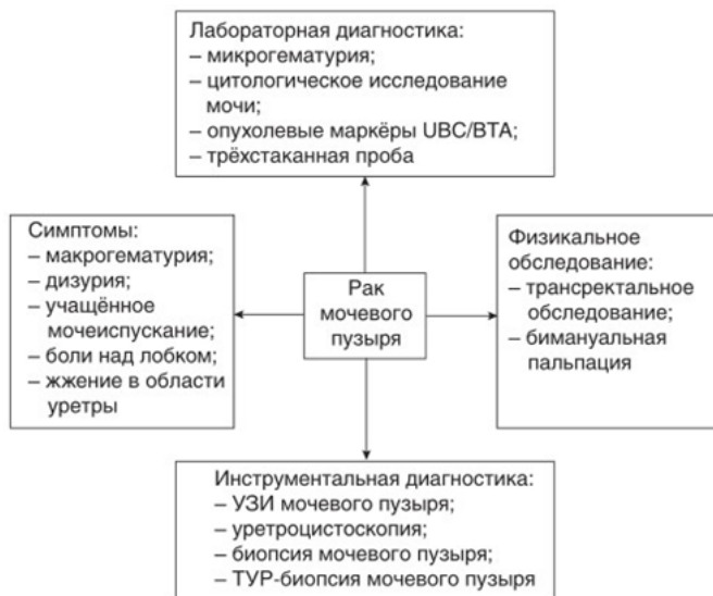
Рисунок 2. Схема уточняющей диагностики рака мочевого пузыря