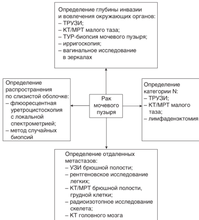
Рисунок 1. Схема первичной диагностики рака мочевого пузыря